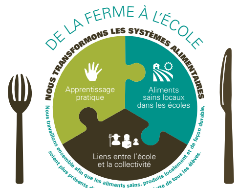
Le système De la ferme à l'école

26 % des élèves indiquent avoir plus envie d'être à l'école.