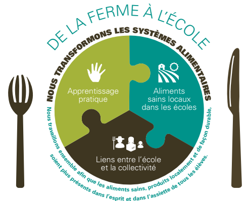
Le système De la ferme à l'école

26 % des élèves indiquent avoir plus envie d'être à l'école.