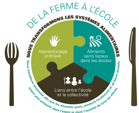
Le système De la ferme à l'école

26 % des élèves indiquent avoir plus envie d'être à l'école.