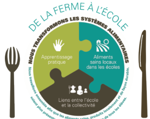
Le système De la ferme à l'école

26 % des élèves indiquent avoir plus envie d'être à l'école.