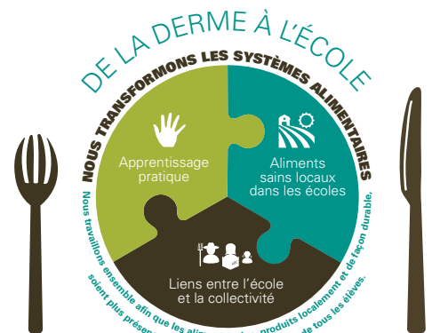
Le système De la ferme à l'école

26 % des élèves indiquent avoir plus envie d'être à l'école.