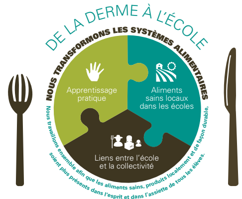
Le système De la ferme à l'école

26 % des élèves indiquent avoir plus envie d'être à l'école.