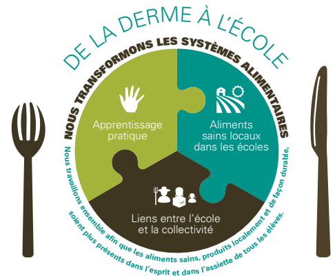
Le système De la ferme à l'école

26 % des élèves indiquent avoir plus envie d'être à l'école.