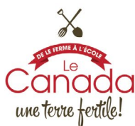
De la ferme à l'école : le Canada, une terre fertile! est une initiative pancanadienne et multisectorielle de prévention des maladies chroniques.

« Nous savions déjà que le bar à salades serait un excellent programme de repas à offrir aux élèves et au personnel de l'école Robb Road, mais ce qui nous a surpris, c'est à quel point les enfants étaient contents de remplir leur assiette de légumes! ÉCOLE ROBB ROAD